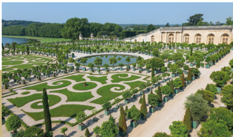
Parc du Château de Versailles