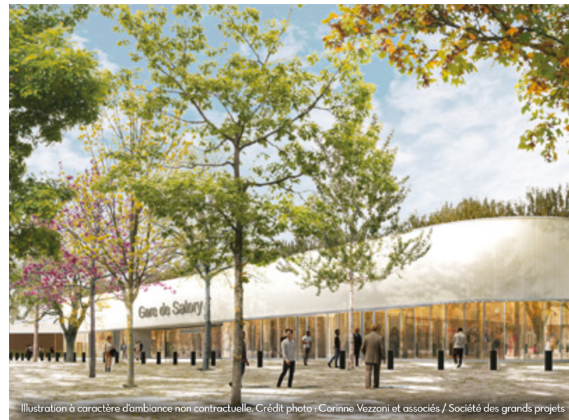
Illustration à caractère d'ambiance non contractuelle.