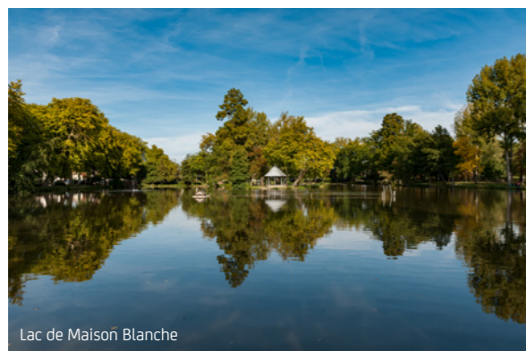
Lac de Maison Blanche