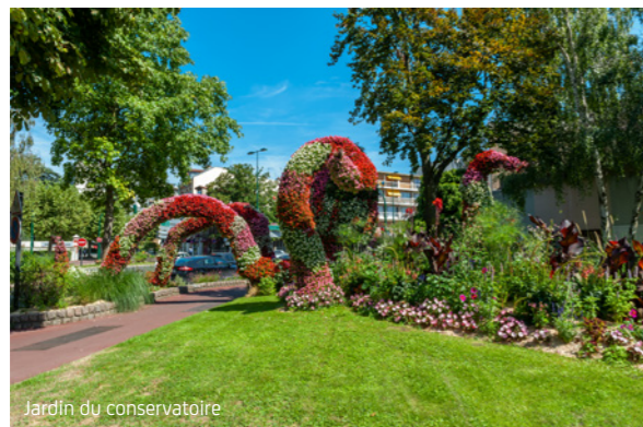
Jardin du conservatoire