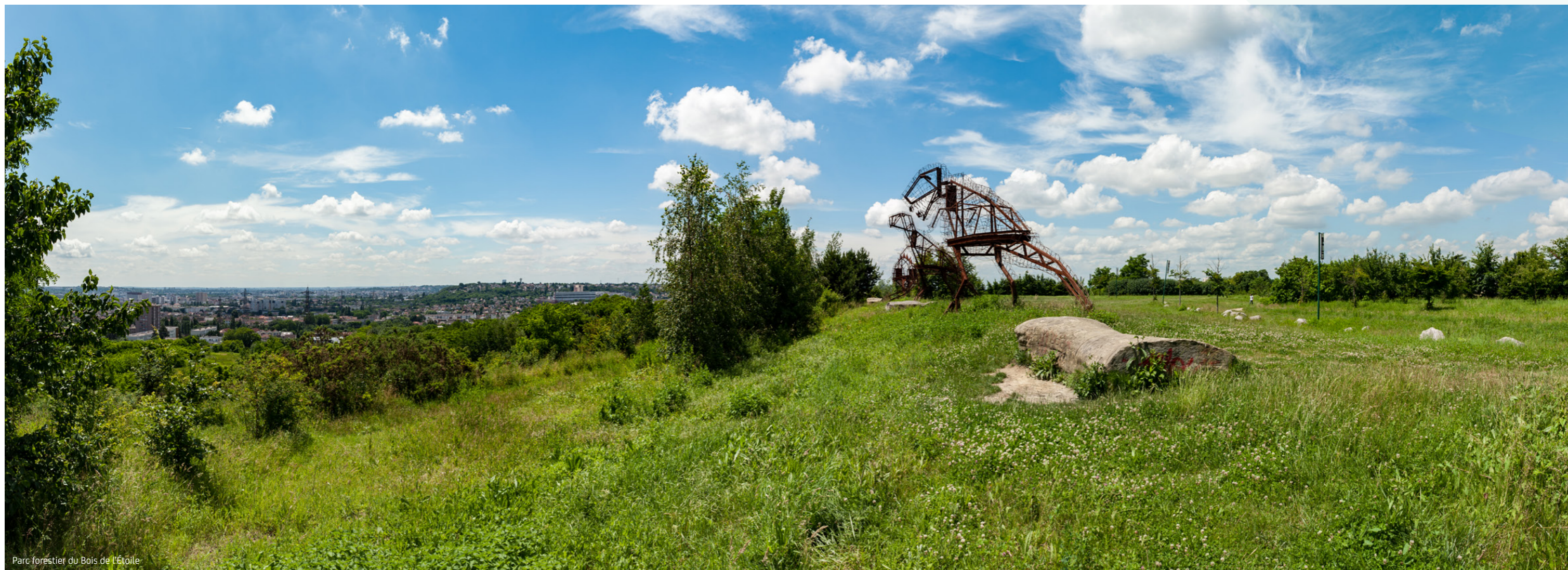
Parc forestier du Bois de l'Étoile

Ville fleurie, Gagny se caractérise par la diversité, la taille et la qualité de ses espaces verts, véritables lieux de détente et de repos, comme l'arboretum et le parc forestier du Bois de l'Étoile, le parc Courbet, le lac de Maison Blanche, les étangs de Maison Rouge.