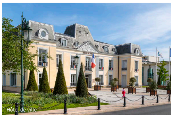
Hôtel de ville