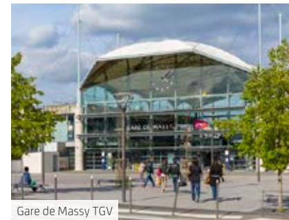
Gare de Massy TGV