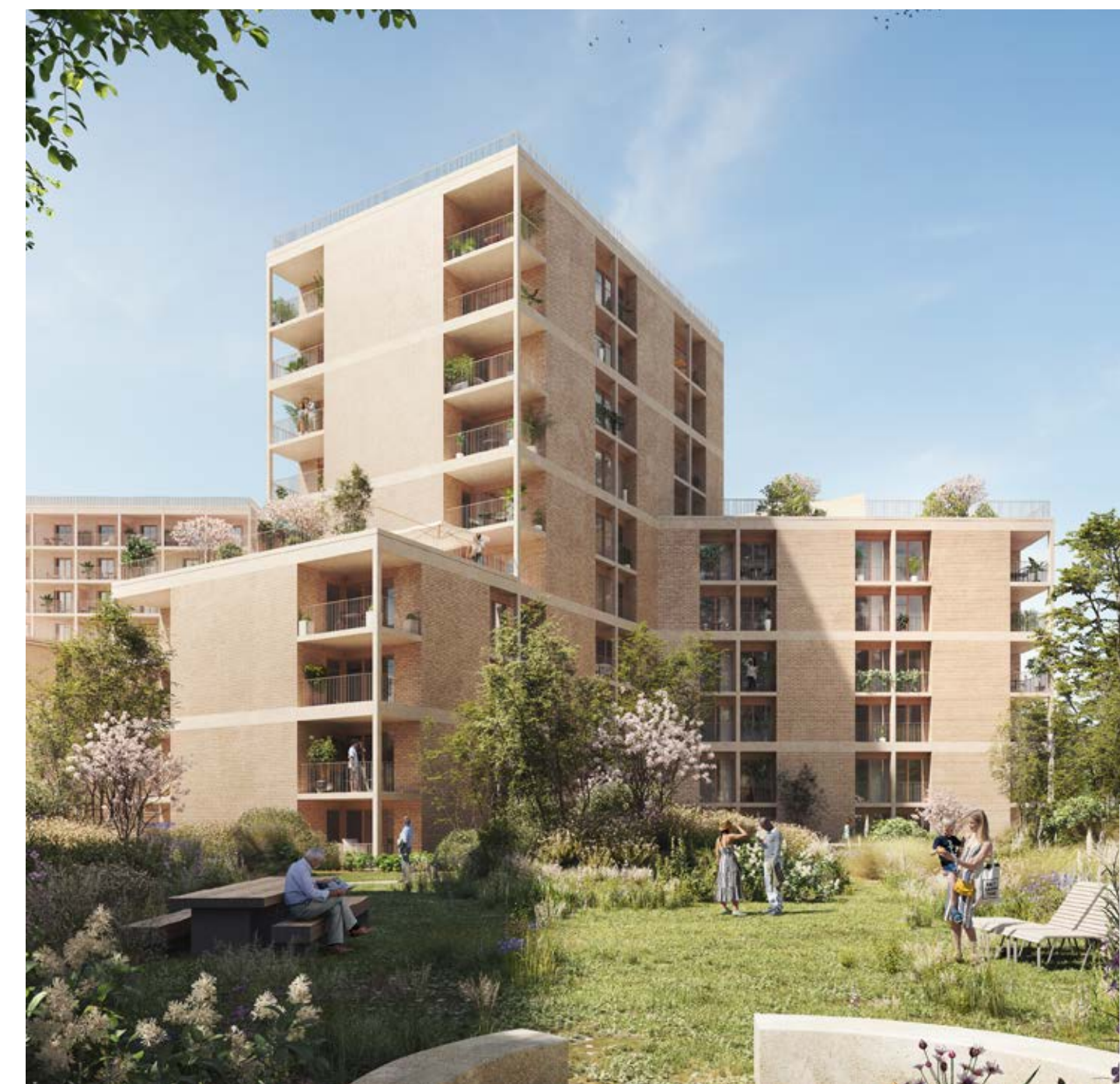
Illustration non contractuelle à caractère d'ambiance.

en bas de chez soi, et l'immense Parc Georges Brassens , à moins de 15 min* à pied, pour des joggings ou promenades en famille. Enfin, pour faciliter le quotidien, commerces et services sont à proximité, ainsi que de nouvelles enseignes au rez-de-chaussée des immeubles.