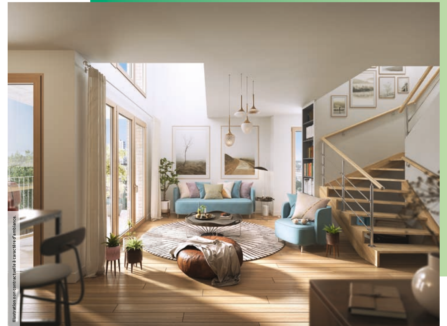
Illustration non contractuelle à caractère d'ambiance.

LE PLAISIR DE VIVRE LA VILLE CÔTÉ NATURE