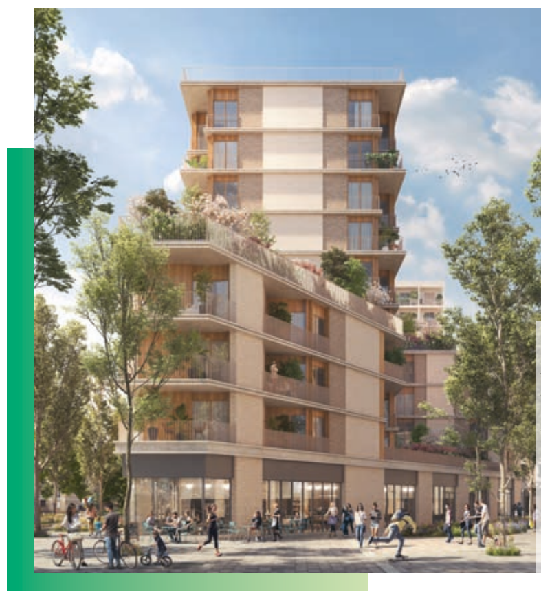
Illustration non contractuelle à caractère d'ambiance.

Suivant l'esprit architectural du quartier, la résidence s'illustre par ses volumes de différentes hauteurs, offrant des vues sur les superbes jardins suspendus et arborés agrémentant les étages de ses 3 émergences. Lumineuses et bordées par une rue traversante et piétonne, les façades minérales s'élèvent harmonieusement dans des nuances claires et plus chaudes. Le bois, également très présent, fait le lien entre les différents bâtiments, habillant menuiseries, occultations et fonds de loggias. Le rythme est donné par les avancées et retraits, donnant naissance à de vastes terrasses à ciel ouvert , ou des espaces plus intimes.