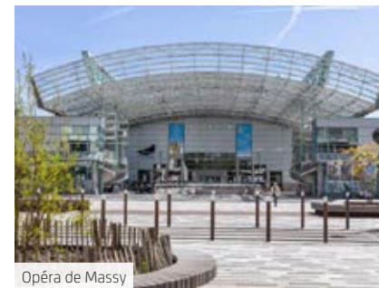
Opéra de Massy