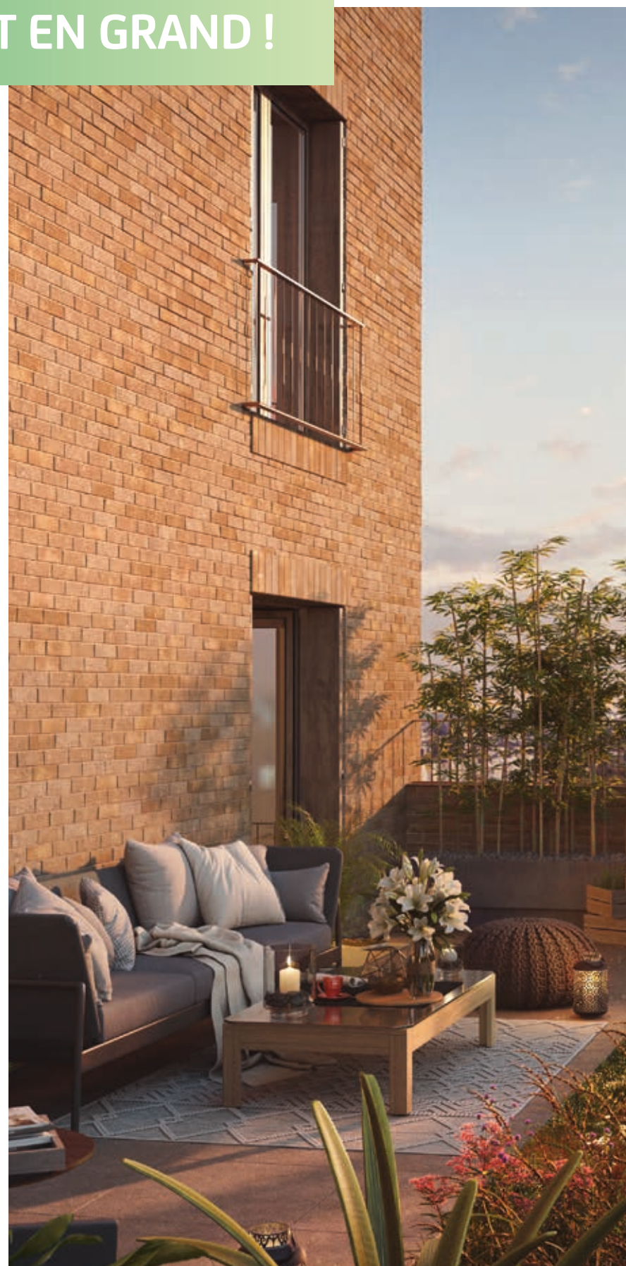
Illustration non contractuelle à caractère d'ambiance.

Profiter d'un espace extérieur à soi est un vrai privilège en ville. Garanti pour la grande majorité des logements, il se présente sous forme de balcon, loggia, jardin privatif... Certains appartements profitent d'une remarquable terrasse plein ciel végétalisée, authentique oasis suspendue et dépaysante, aux vues dégagées sur le paysage.