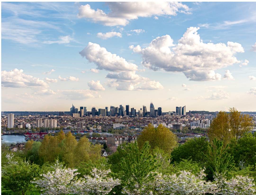
Paris, vue de la Butte d'Orgemont à Argenteuil, Val-d'Oise

Les Argenteuillais profitent d'un cadre empreint de vitalité !