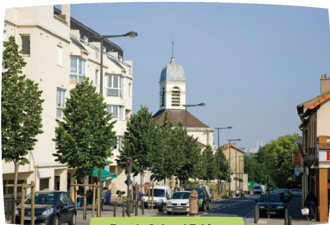
Rue du Colonel Fabien