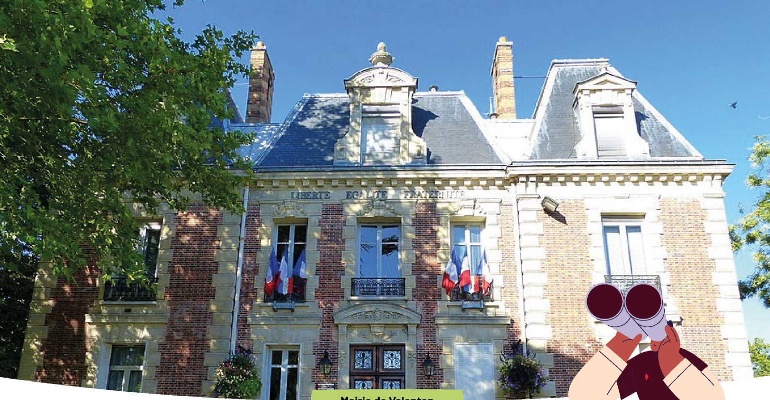
Mairie de Valenton