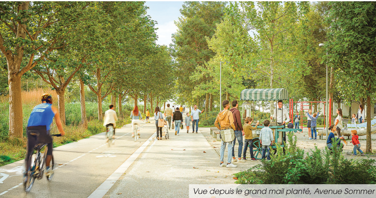
Vue depuis le grand mail planté, Avenue Sommer

POUR LES ACTIFS : une mobilité renforcée avec la ligne 18 et la proximité immédiate du pôle d'emplois de Saclay.